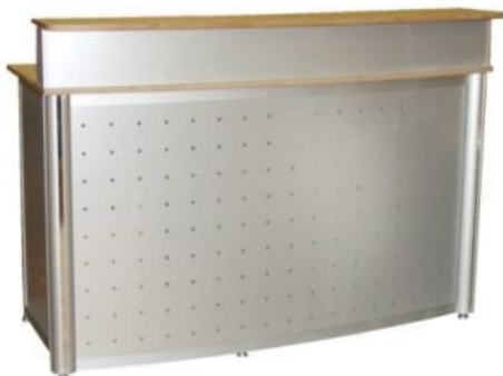
Messetheke Rastatt Board Buche mit Rundstützen Breite ca. 1,50m 920 .-€

Angebote der Firma Dreher Messebausysteme richten sich ausschließlich an Unternehmer und gewerbliche Wiederverkäufer, nicht jedoch an Endverbraucher.