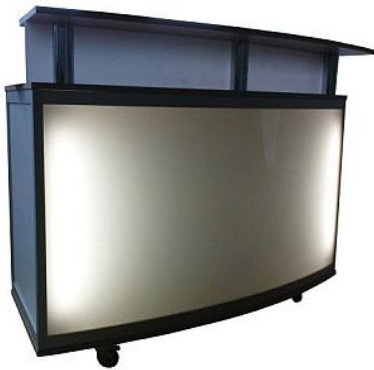
Leuchtheke Augsburg rollbar Board Buche Breite ca. 1,50m 820.-€

alle Preise zzgl. MwSt und Lieferkosten (Angebote nur solange vorrätig. Abbildung ähnlich)