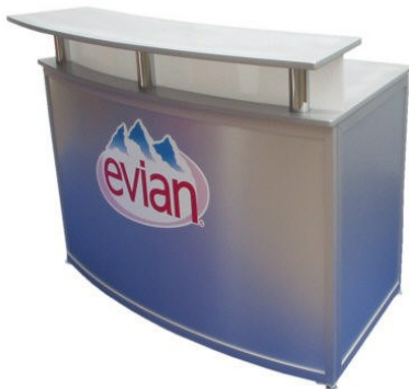
Promotiontheke Pirna Breite ca. 1,50m 700.-€

Angebote der Firma Dreher Messebausysteme richten sich ausschließlich an Unternehmer und gewerbliche Wiederverkäufer, nicht jedoch an Endverbraucher.